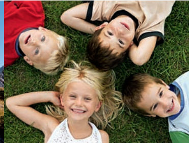
Fashion & Business