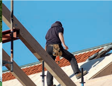
Workwear & Uniforms